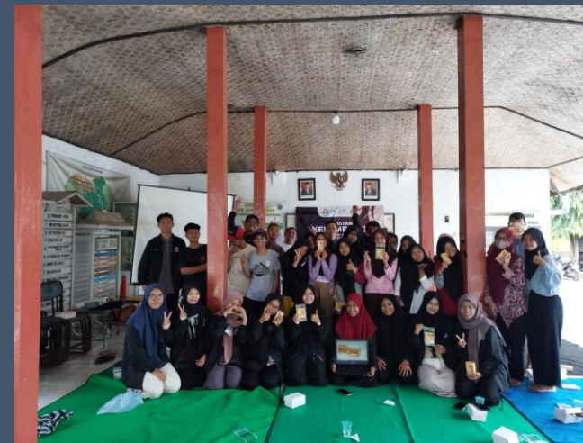
WORKSHOP DIGITAL MARKETING DAN DESAIN GRAFIS