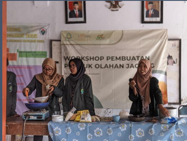
WORKSHOP PEMBUATAN NUGGET JAGUNG