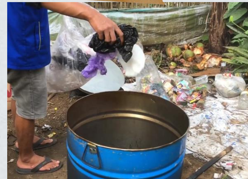
Memasukan sampah plastik ke dalam drum peleburan