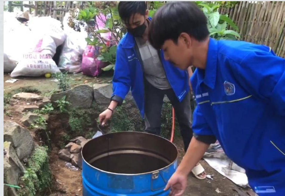
Menyiapkan tempat peleburan