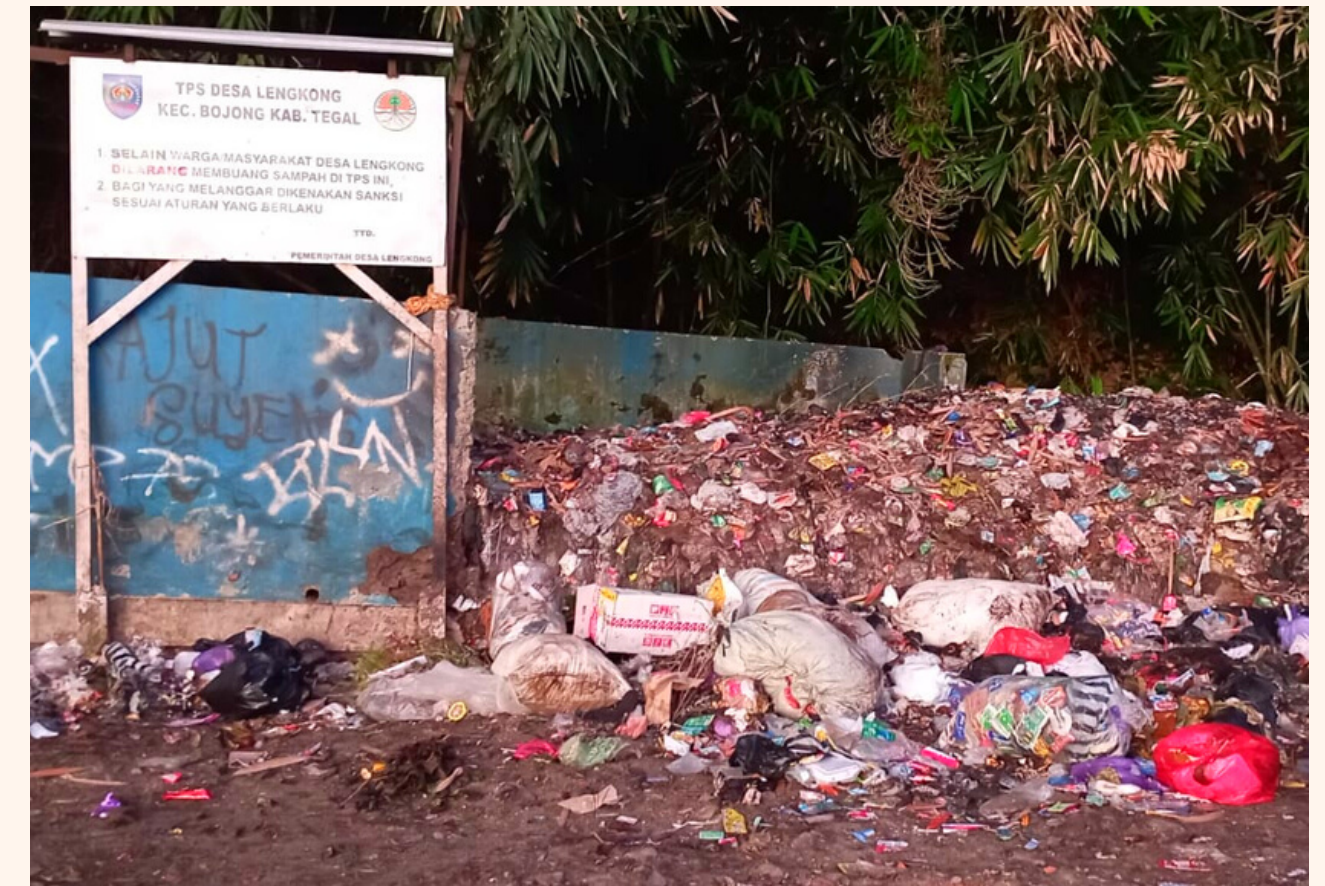
TPS DESA LENGKONG

Salah satu permasalahan lingkungan yang terdapat di Desa Lengkong adalah manajemen sampah, dimana sampah yang masuk ke TPS setiap harinya dengan sampah yang diangkut ke Tempat Pembuangan Akhir (TPA) tidak sebanding sehingga membuat TPS meluber. Oleh karena itu, kami mencoba memberikan solusi atas permasalahan tersebut dengan pengenalan prinsip 3R (Reduce, Reuse, Recycle) kepada warga sekitar. Pada kali ini, kami mengenalkan pembuatan ecobrick sebagai salah satu bentuk penerapan prinsip 3R yang nantinya akan membantu mengurangi volume sampah yang masuk ke TPS dengan pemilahan sampah sehingga sampah dapat dimanfaatkan kembali dan memiliki nilai ekonomis.